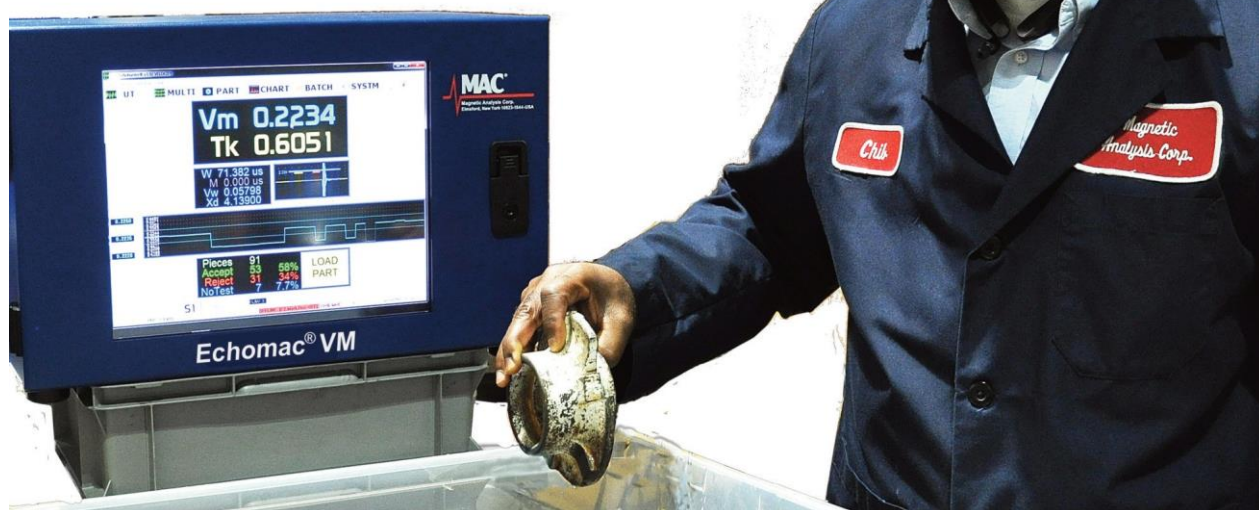
Tela A-scan mostrando os resultados do ensaio de uma peça

O novo aparelho Medidor de Velocidade Sônica Echomac ® VM é projetado e fabricado pela Magnetic Analysis Corporation - EUA, líder no fornecimento de aparelhos, sistemas e serviços de Ensaios Não Destrutivos, com 90 anos de existência.