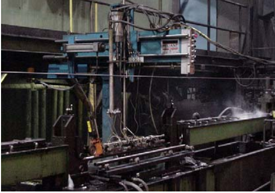
Estación de inspección de ultrasonido con electrónica Echomac, en una línea de soldadura de tubos en la empresa Wheatland Tube, Arkansas, USA, con acoplamiento por chorro de agua (squirter).