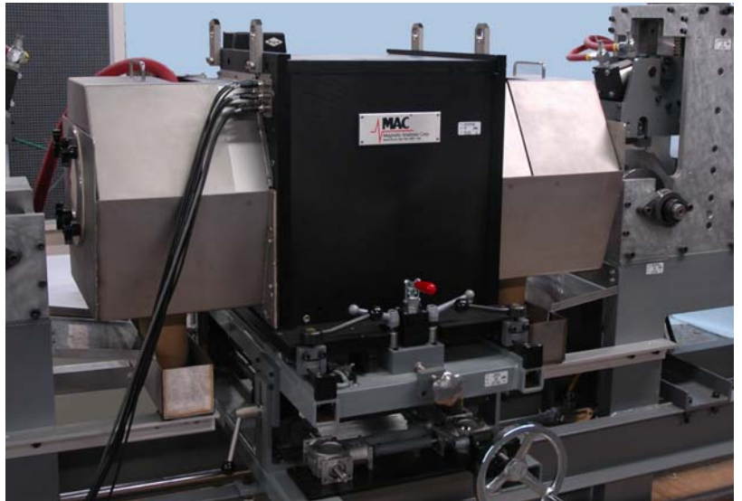
Sistema rotativo Echomac de 7 canales montado sobre una mesa de elevación, para inspeccionar material con diámetro hasta 4" (101.6mm). Los transductores rotativos se encuentran dentro del cabezal negro, el cual también contiene el agua a presión para acoplamiento.

Con transductores rotativos el material puede ser transportado a una mayor velocidad. El Echomac FD-4 puede ser usado en conjunto con Cabezales Rotativos de MAC o de otros fabricantes.