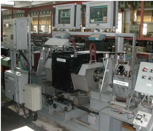
Sistema MAC para inspección de tubos incluyendo un Cabezal Rotativo Echomac, montado sobre una mesa de elevación, un equipo de ensayos por corrientes inducidas con bobina envolvente y un desmagnetizador para disminuir el magnetismo residual.

Un sistema multi-canal con inspección de todo el cuerpo del material es ideal para detectar defectos longitudinales y transversales y para medir el espesor de pared en una única estación utilizando un Cabezal Rotativo Echomac o de otro fabricante.