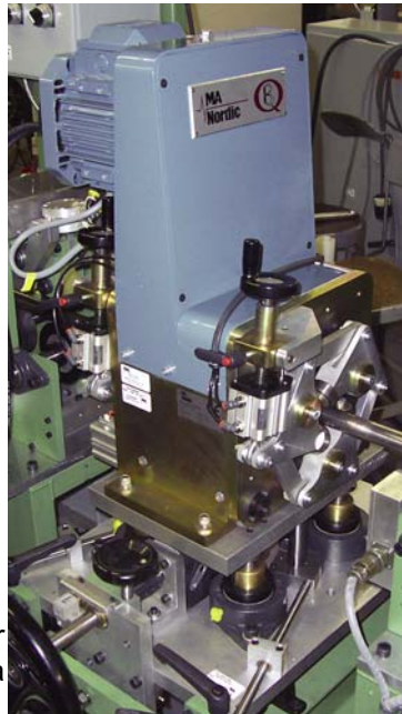
Cabezal rotativo E

Cuando la amplitud de un defecto excede niveles programados de umbral, las salidas de puertas asignadas