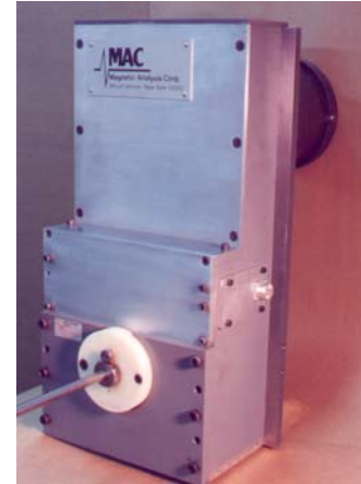
Cabezal rotativo 150