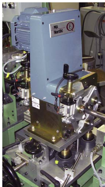
Cabeçote Rotativo-Tipo E

A amplitude do sinal na tela é proporcional à profundidade do defeito. Quando a amplitude do defeito ultrapassa o limiar pré-ajustado de alarme, se ativam as