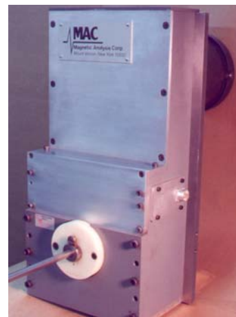
Cabeçote Rotativo Tipo 150