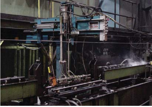
MAC Echomac电子设备公司阿肯色Wheatland钢管厂的喷射器类型超声波检测站正在一条焊接在线使用此检测系统。