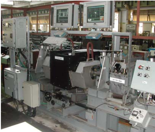
利用安装在高台上的Echomac超声波旋转式检测仪进行管材检测，利用退磁仪去除残留磁性，并利用MAC系列涡流环绕线圈进行检测。

在单一工作站使用MAC Echomac 旋转式检测仪或其他旋转式检测仪时，多通道整机运行很适合检测纵向、横向裂纹及壁厚。